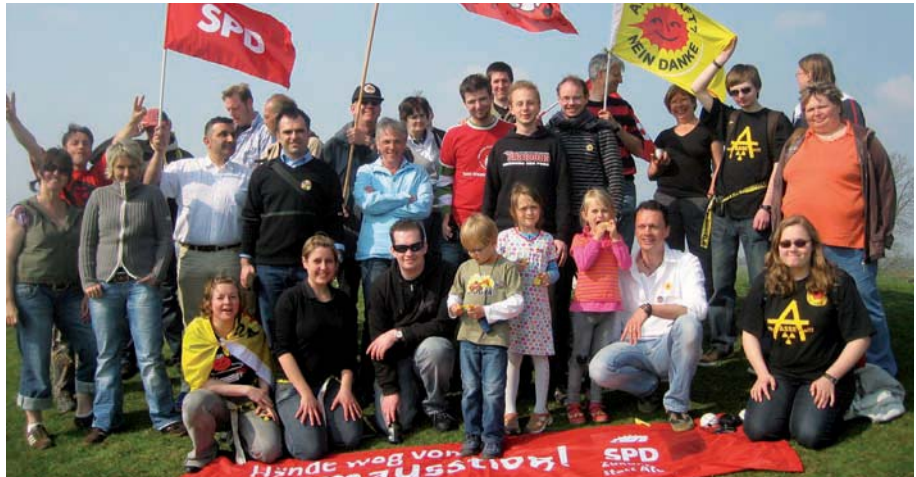
Jusos bei der KETTENreAKTION 2010

KETTENreAKTION 2010 – Über 120.000 Menschen bildeten am 24. April 2010 eine 120 Kilometer lange Menschenkette zwischen den Atomkraftwerken Brunsbüttel und Krümmel. Wir Jusos aus Braunschweig beteiligten uns am Streckenabschnitt beim AKW Brokdorf. Die Botschaft war klar: Gemeinsam ein Zeichen setzen gegen die Atomkraft und die von Schwarz-Gelb geplante Laufzeitverlängerung von Atomkraftwerken. Für uns Jusos ist das Konzept der unumkehrbaren, nicht-rückholbaren Endlagerung radioaktiver Abfälle gescheitert: Weltweit gibt es noch keine Lösung für die Endlagerung von Atommüll, der für Jahrtausende sicher gelagert werden muss. Deshalb muss es endlich fundierte Kriterien und einen transparenten Prozess für die Festlegung von Atommüllendlagern geben. Die anhaltende Krise um das Atommüllendlager Asse II verdeutlicht die Gefahren. Deshalb fordern wir seit Jahren die Rückholung des Atommülls aus diesem Endlager sowie den Stopp der Erkundung der geplanten Atommüllendlager in Gorleben und Schacht Konrad.