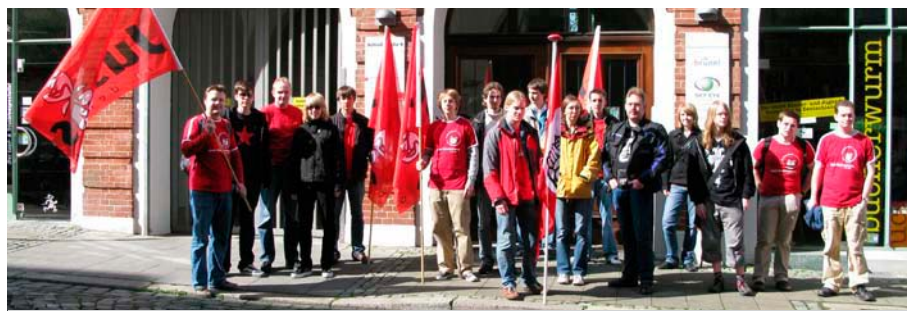
Geschichte schreiben, Zukunft gestalten – Jusos bei der Maidemo

Der 1. Mai wird auch als Kampftag der Arbeiterbewegung und als Tag der Arbeit bezeichnet und ist heute ein gesetzlicher Feiertag. Wie und warum ist aber der 1. Mai entstanden?